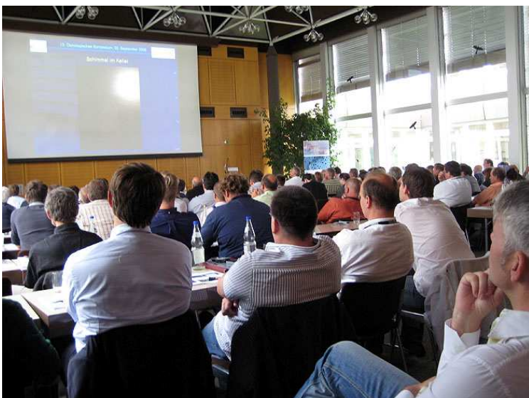
13. Oenologisches Symposium